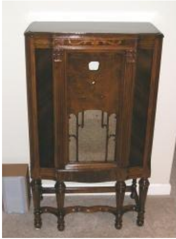
Aparato receptor de la década de 1930

Comenta Velázquez (2008) que en sus inicios los aparatos receptores, que consistían de cajas de madera con bulbos y una bocina, se denominaban teléfonos , posteriormente fueron conocidos como radiolas , para terminar en radios ; la radiodifusión se denominaba telefonía inalámbrica, al contar con la capacidad de transmitir y recibir información, música, radionovelas y eventos culturales, sin necesidad de utilizar hilos o alambres.