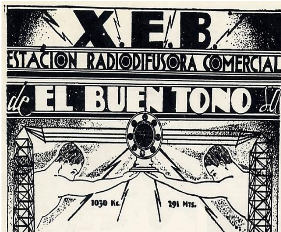
XEB Radio El Buen Tono

Publicidad de los cigarrillos Campeones de El Buen Tono S.A. [Rodríguez, 2007]