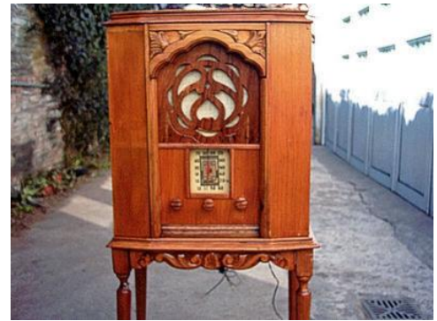
Aparato receptor de la década de 1930

Comenta Velázquez (2008) que en sus inicios los aparatos receptores, que consistían de cajas de madera con bulbos y una bocina, se denominaban teléfonos , posteriormente fueron conocidos como radiolas , para terminar en radios ; la radiodifusión se denominaba telefonía inalámbrica, al contar con la capacidad de transmitir y recibir información, música, radionovelas y eventos culturales, sin necesidad de utilizar hilos o alambres.