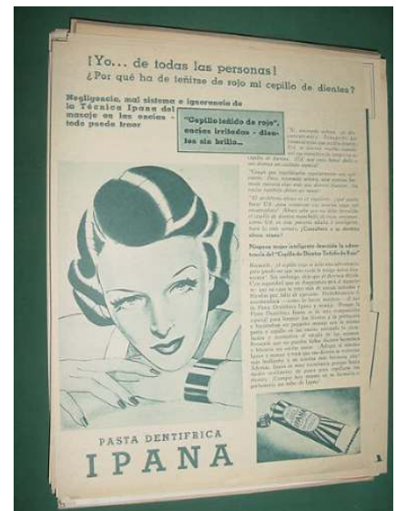
Publicidad del dentífrico Ipana

Las primeras estaciones privadas, según Mejía (2007), serían las instaladas conjuntamente por el periódico El Universal y la tienda de artículos electrónicos La Casa del Radio de Raúl Azcárraga, que operó de 1922 a 1928, y que transmitiría la primicia poética Radio , del estridentista Manuel Maples Arce , como ya habíamos señalado. Dentro de su programación, que era similar a las de otras estaciones, comenta Velázquez (2008), se transmitían conciertos, programas educativos, emisiones especiales dedicadas a un Estado de la República, segmentos de radioaficionados con dotes artísticas, conciertos de piano y de orquestas y, también era común, la participación de Orquestas Típicas de corte nacionalista, como la del maestro Miguel Lerdo de Tejada. La propaganda incluía cigarrillos o anuncios de productos de la empresa Colgate-Palmolive , además de realizar programaciones en directo, para el dentífrico Ipana , con músicaailable de fox-trot , tango , vales , danzones y blues , además de interpretaciones de canciones de Alfonso Esparza Oteo , Joaquín Pardavé o Guty Cárdenas , que cerraba su emisión con la frase: Sonríe mejor quien usa IPANA , ofreciendo a quienes reportaran la transmisión un tubo de pasta que les duraría diez días.