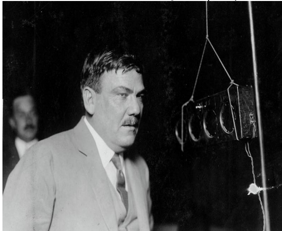
Plutarco Elías Calles en campaña en la radio [1924]

Todas las agrupaciones sindicales afiliadas a la CROM contaban con un receptor y bocinas en sus locales, donde se reunían los obreros a escuchar las pláticas que se ofrecían a través de este medio, las que se alternaban con números musicales o de entretenimiento [Velázquez (1981: 100)].