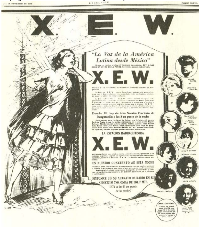
Inauguración de la XEW (18 de septiembre de 1930)

Más tarde, a partir de los años de la década de 1940, se combinaron las emisiones en directo con programas previamente grabados, por lo que la difusión de discos con grabaciones musicales era solo complementaria. El éxito comercial de las estaciones de radio conduciría, en 1941, a la integración del primer consorcio de empresas, Radio Programas de México , RPM, que aglutinaría a la mitad de las estaciones del país, contaría con la publicidad de 130 empresas y sería la primera organización radiofónica en explotar comercialmente, a través de las estaciones XEW y la XEQ , las grabaciones de programas radiofónicos en cinta magnética y discos de acetato.