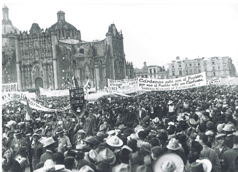
Manifestación en el zócalo de la ciudad de México, de apoyo a la expropiación petrolera realizada en 1938

Como respuesta el gobierno cardenista vendió el combustible a los países fascistas, lo que condujo al reconocimiento norteamericano del derecho nacional a los recursos naturales; al mismo tiempo que, con el retiro de nuestro embajador en Londres, se logró la aceptación inglesa a la expropiación. La gran preocupación imperialista estaba fija en el inicio de la Segunda Guerra Mundial y el control de los hidrocarburos mexicanos.