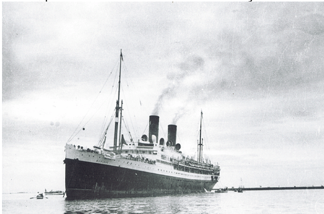
El Mexique transportó a los niños refugiados españoles

Al ser derrotada la República Española, nuestro país ofreció refugio a miles de desplazados por el fascismo, al mismo tiempo que el gobierno cardenista se pronunció en contra de la invasión italiana a Etiopía. De igual forma se protestó por la anexión de Austria por la Alemania de Hitler y la invasión de Polonia por los nazis, y de igual manera, por la invasión soviética de Finlandia y Polonia.