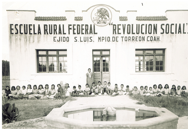
Escuelas rurales en las áreas de desarrollo de la reforma agraria

La CGOCM de Lombardo Toledano impulsaba la unificación obrero-campesina; sin embargo, al gobierno no le convenía una central única por el riesgo político que implicaba; la central campesina se integraría dentro del partido oficial, con la reorganización social dirigida corporativamente por el Estado; en donde el PNR, que había sido integrado por caudillos, en una alianza entre individuos, no aglutinaba ya a las fuerzas sociales. Al contar con verdaderos instrumentos políticos de masas, de apoyo a la política cardenista, se reorganizó al PNR como un partido de masas, con una organización estructurada sectorialmente: obreros, campesinos, sector popular y militares, para acabar con los cacicazgos regionales y terminar con el maximato callista, mediante un organismos de múltiples representaciones, creándose así el Partido de la Revolución Mexicana , PRM.