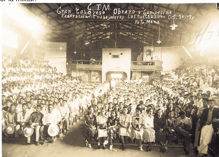
Los sindicatos de la industria constituyeron la fuerza laboral fundadora de la Confederación de Trabajadores Mexicanos AGN, Colección Fotográfica de la Presidencia de la República, Lázaro Cárdenas

El cardenismo se inició con un nuevo principio político, eliminar el militarismo, a pesar de pertenecer a las fuerzas armadas triunfantes de la Revolución; ahora, en congruencia con el Plan Sexenal, se procedería a la reorganización política de la sociedad, atendiendo los principios más populares del movimiento revolucionario, por la vía civil y no por la militar.