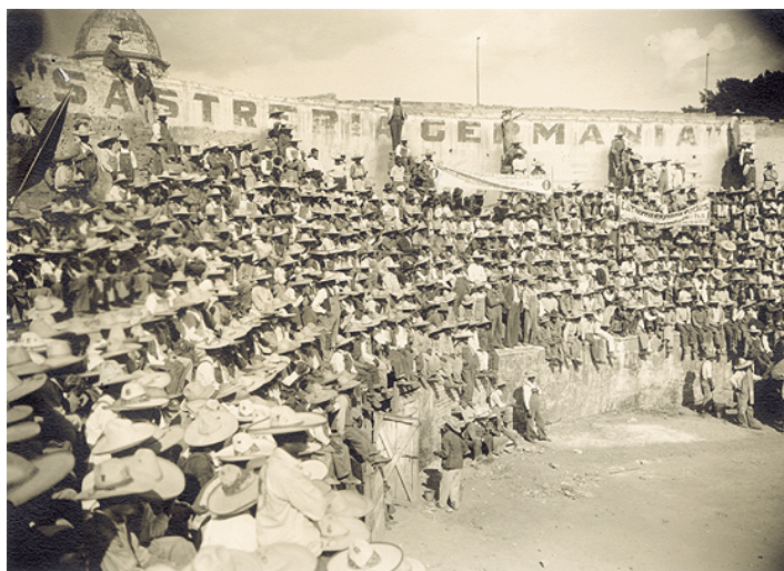
Gran Convención en Irapuato de la Liga Coordinadora Guanajuatense de Miembros del PNR. Diciembre 13 de 1936

El 9 de julio de 1935 Cárdenas decretó la constitución de una central nacional, como requisito indispensable para que los campesinos recibieran la tierra, encargando al partido oficial la organización de la central, que tendría ligas