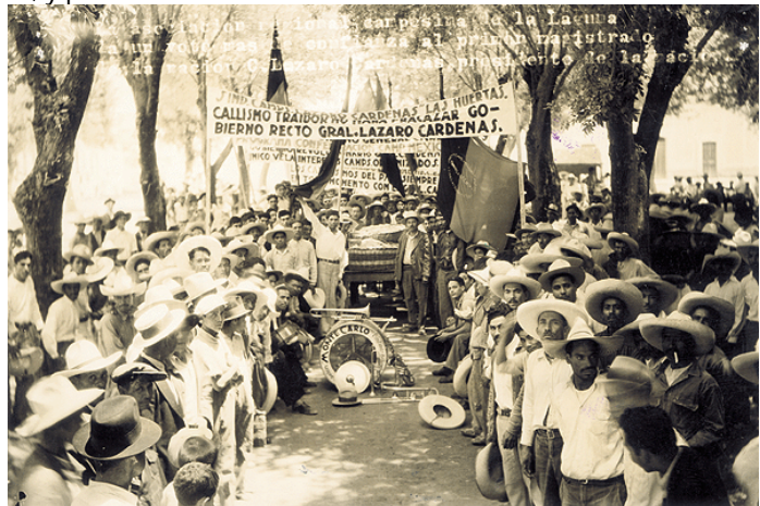
El conflicto Calles-Cárdenas culminó con la expulsión del Jefe Máximo AGN, Colección Fotográfica de la Presidencia de la República, Lázaro Cárdenas

El grupo gobernante respondió con la organización social, en una campaña entre junio de 1935 y abril de 1936, que creó un Comité Nacional de Defensa Proletaria , como apoyo a los sindicatos obreros; al mismo tiempo que se realizaban acciones a favor del reparto agrario ejidal, que impulsaba el Estado, como respuesta a Calles.