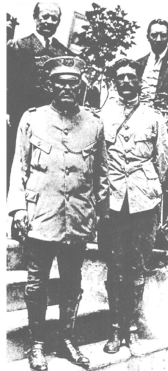
Victoriano Huerta y Guillermo Rubio Navarrete Hemeroteca Nacional

http://www.nevadaobserver.com/Mexican%20Revolution%20-%20People/Signers%20of%20the%20Plan%20of%20Guadalupe.jpg