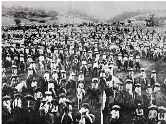
Fuerzas zapatistas http://es.wikipedia.org/wiki/Archivo:Fuerzas_surianas_a_las_ordenes_de_Emiliano_Zapata.jpg