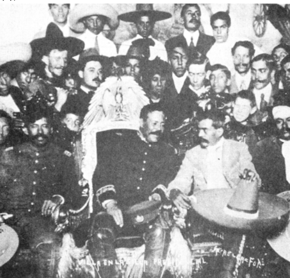
Tomás Urbina, Villa, Zapata y Otilio Montaña en Palacio Nacional 1914. Library of Congress

http://www.nevadaobserver.com/Mexican%20Revolution%20-%20People/LOC/Fierro_%20Villa_%20Ortega%20and%20Col.%20Medina%20LoC.jpg