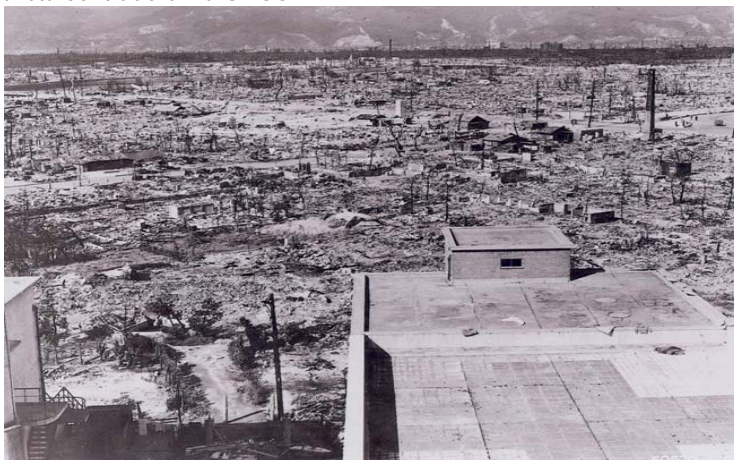
Hiroshima, Japón, después del bombardeo atómico en 1945 http://es.wikipedia.org/wiki/Imagen:AtomicEffects-Hiroshima.jpg