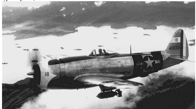
Avión del escuadrón 201 de patrulla sobre las Filipinas

http://www.ipmsstockholm.org/magazine/2002/12/images/velasco_p47_04.jpg