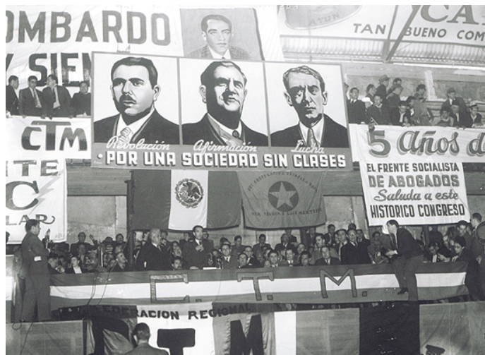
Fidel Velázquez toma posesión como presidente de la Confederación de Trabajadores Mexicanos el 28 de febrero de 1941