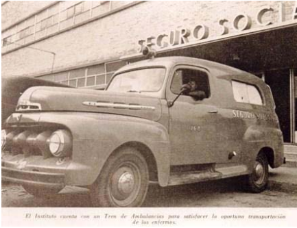
El Instituto cuenta con un Tren de Ambulancias para satisfacer la oportuna transportación de los enfermos.