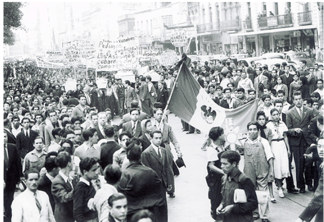
Manifestación almanista en la ciudad de México

Al margen del partido oficial los almanistas iniciaron una organización propia y, el 25 de julio de 1939, anunciaron la candidatura de Almazán. La respuesta popular fue de gran impacto, más de 250 mil personas lo recibieron en la ciudad de México en su inicio de campaña, que dio lugar al Partido Revolucionario de Unidad Popular (PRUN). El PRUN integró disidentes del PRM, del Partido Laborista, del Partido Nacional Agrarista y miembros del Partido Acción Nacional; que no presentó candidato, ya que recientemente se había formado por Manuel Gómez Morín, y se integraba por católicos ciudadanos integrantes de la clase media y alta, de ideología democrática, antimilitar y conservadora.