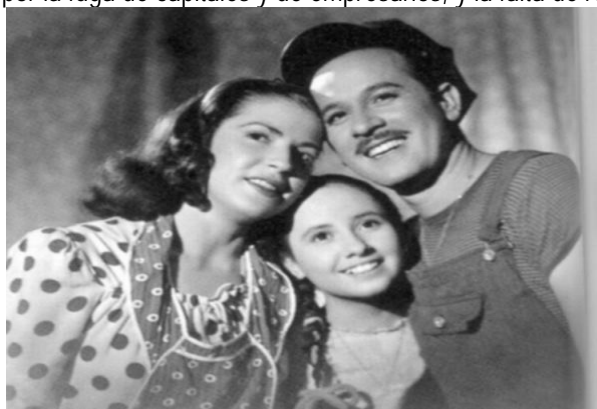
1947: Ismael Rodríguez, Nosotros los pobres , Blanca Estela Pavón, Evita Muñoz Chachila y Pedro Infante

Después de la Revolución, en nuestro país fue necesario enfrentar la desarticulación de las actividades económicas debido a las movilizaciones de la lucha armada. En el aspecto político la desaparición del porfiriato y la reconstrucción del Estado, significó transitar un período de caudillismo y regionalización, y la reconstrucción de las instituciones y los mecanismos de gobernabilidad y legalidad. En lo económico se intensificó, con la pérdida de un mercado nacional e internacional, la agricultura extensiva y la afectación sensible de la industria; que se incrementó por la fuga de capitales y de empresarios, y la falta de recursos financieros.