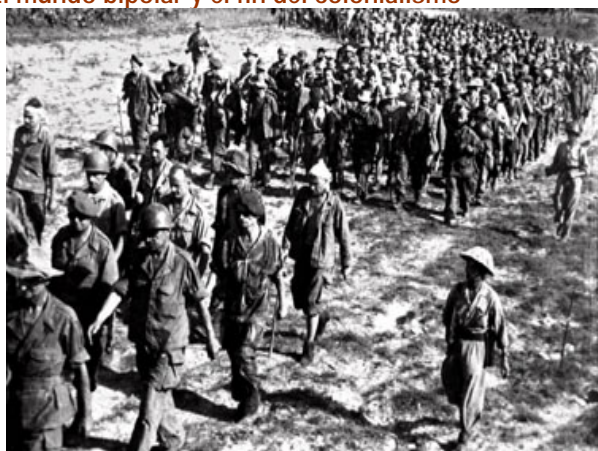
Prisioneros franceses de la Legión Extranjera , después de la derrota en Dien Bien Phu, Viet Nam, el 7 de Mayo de 1954, (AP photo/Vietnam News Agency), http://www.afa.org/magazine/aug2004/0804dien.asp