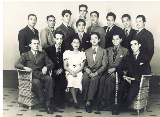
¿La nueva revolución? Comité Ejecutivo Nacional del Frente Popular de Jóvenes Revolucionarios AGN, Colección Fotográfica de la Presidencia de la República, Manuel Ávila Camacho

Para apoyar al aparato productivo norteamericano se exportó mano de obra mexicana, para ocupar los puestos dejados por los jóvenes incorporados en sus fuerzas armadas; alcanzando los 300 mil trabajadores en un acuerdo firmado en 1942, lo que impulsó que ilegalmente emigraran miles más.