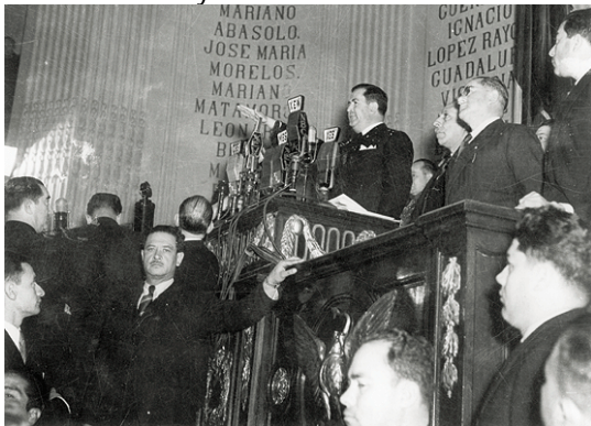
Toma de posesión de la Presidencia de la República del general Manuel Avila Camacho en el Palacio Legislativo

La coalición anticardenista del PRUN era heterogénea, y Almazán organizó una exitosa campaña ofreciendo todo, sin una línea fija, a los que querían escucharlo. En los mítines se expresaba a veces como un zapatista y en otras ocasiones como el empresario exitoso que era y, en ocasiones, como un agraviado integrante de la clase media. Su lema fue "Libertad y Orden".