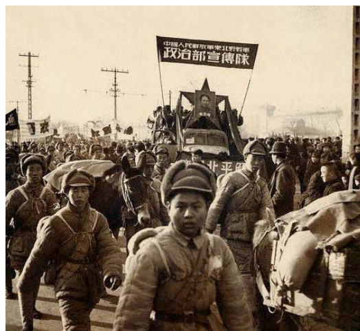
1949 el Ejército Rojo entrando en Pekin

La época de la posguerra es una época de lucha entre dos modelos económicos y sociales: el capitalista y el socialista. En la agonía del fascismo los líderes aliados y de la URSS se reunieron en Yalta, para acordar el mundo