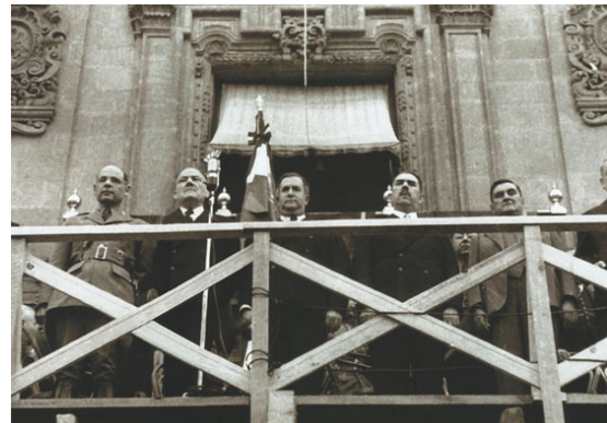
Abelardo L. Rodríguez, Calles, Ávila Camacho, Cárdenas y Portes Gil