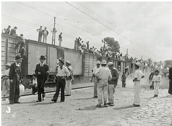
Braceros emigrando al norte. Córdoba, Veracruz, 1941