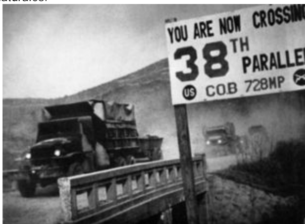
1953: Las fuerzas de las Naciones Unidas cruzan el paralelo 38

Olvidaron que los grandes imperios coloniales estaban incapacitados económica y militarmente para recuperar sus colonias en Asia, África y el Medio Oriente. En 1945 se creó la Organización de las Naciones Unidas , ONU, teniendo como principios los ideales democráticos y la autodeterminación de los pueblos; con lo que se iniciaron numerosas guerras denominadas de baja intensidad , impulsadas por los habitantes de las antiguas colonias europeas, como luchas de liberación nacional, buscando su autodeterminación y la liberación de sus recursos naturales.