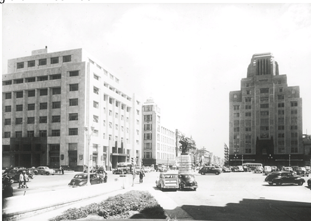
Transformación paulatina de la ciudad de México

Se aprovechó el auge en las exportaciones, la moderación de los dirigentes políticos, la inversión privada y los créditos del exterior.