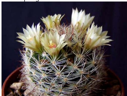
Biznaga ( Mammillaria mathildae )

Sólo entre los pueblos cazcanes y los pames existió algún grado de prácticas religiosas formalizadas, con templos y lugares sagrados. Creían que podían adquirir las cualidades de otros seres humanos o de animales, pintándolos o grabándolos en diversos objetos o sobre la piel; otra forma de adquirir estas características era comiéndoselos, por lo que practicaron la antropofagia.