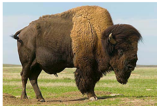
Bisonte americano ( Bison bison )

Por otra parte, en las praderas que se extienden entre los Montes Apalaches y las Montañas Rocallosas, en un inmenso territorio que va desde los Grandes Lagos, hasta los desiertos del sur de Norteamérica, numerosos pueblos transitaban de la caza especializada de fauna pleistocénica, propia de una época glacial que terminó hace miles de años, a la especialización en la cacería del búfalo y la recolección en las zonas altas cubiertas de pinos, conformando diversas tradiciones culturales que integraban a numerosos pueblos que acampaban durante ciertos períodos de tiempo, siguiendo las migraciones de las manadas que se movían entre las fuentes de alimentación del verano y el invierno a lo largo de este inmenso territorio, hasta su casi extinción por efecto de la expansión de poblaciones anglo sajonas, al formarse los Estados Unidos de Norteamérica.