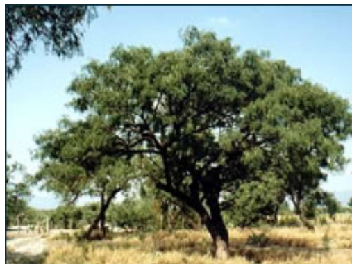
Arbol de Mezquite ( Prosopis laevigata )