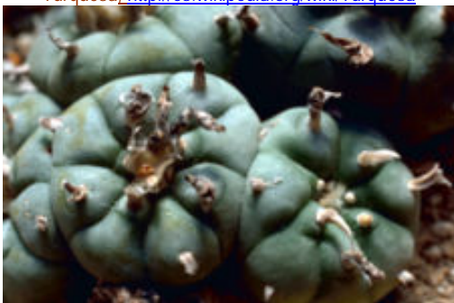
Peyote ( Lophophora williamsii ) http://es.wikipedia.org/wiki/Peyote

Mantuvieron como centro de operaciones un área nuclear de 100 km. de diámetro, limitada por la región de la actual ciudad de San Luis Potosí al oeste, la zona de Guadalcázar al norte, el área del Río Verde al este y el actual Estado de Guanajuato al sur, en una región formada por el Tunal Grande (Valle de San Luis Potosí), la cuenca del Río Verde y una pequeña parte de la actual región potosina de Panino Ixtlero.