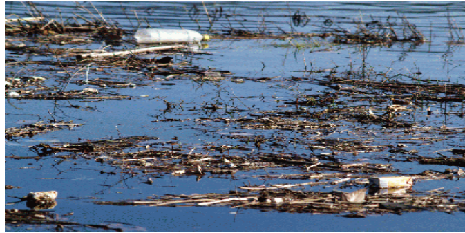
Ilustración Suelo inundado. Exceso de fertilizantes y basura.