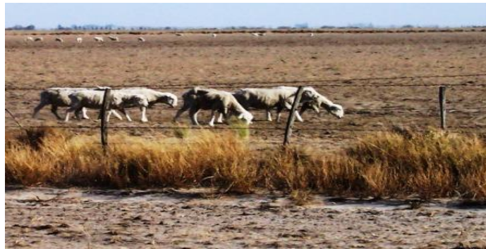
Ilustración Motivo de la erosión del suelo