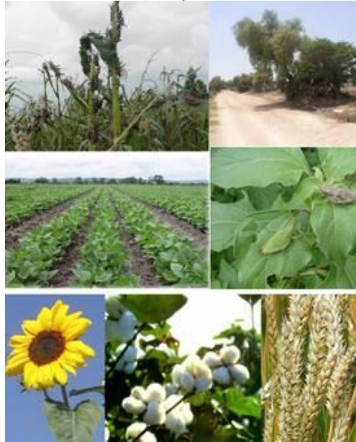
Ilustración Usos del suelo