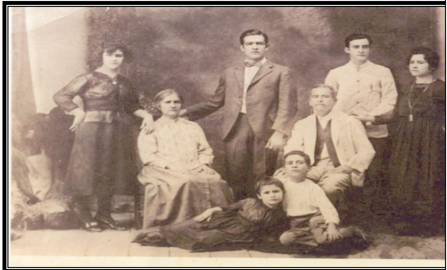
La familia Covarrubias 1920

Después del trabajo previo, mis alumnos respondieron a las siguientes preguntas: