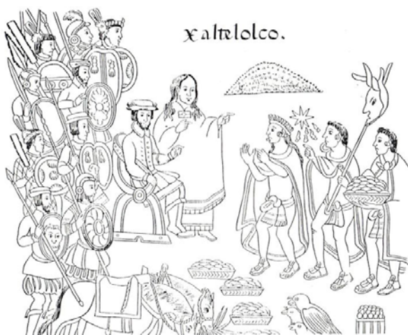
Diego Muñoz Camargo Historia de Tlaxcala , c. 1585

http://es.wikipedia.org/wiki/Imagen:LA2-Bering-Sea.png