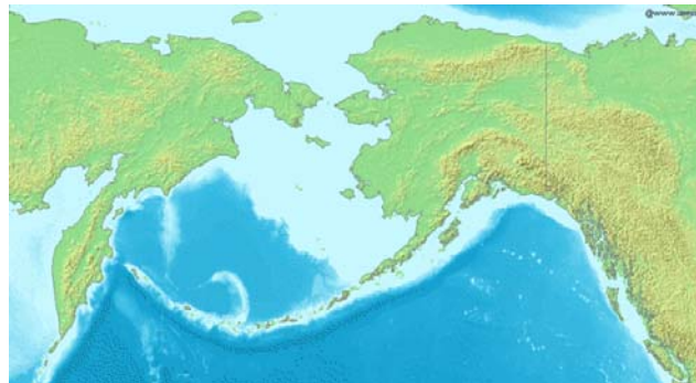
Mar de Bering

El término se aplica, en forma genérica, a todo lo que se refiere a una población originaria de un territorio, cuyo establecimiento antecede a otros pueblos y cuya presencia es lo suficientemente prolongada y estable como para considerarla como nativa de ese lugar.