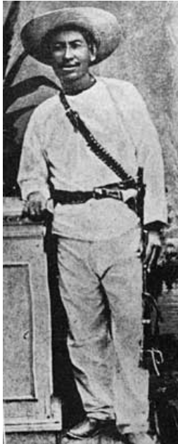
Cajeme jefe de los Yaqui 10

http://es.wikipedia.org/wiki/Cajeme_%28Caudillo_Yaqui%29