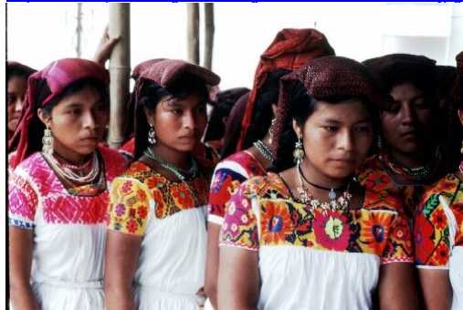
Blusas y rebozos nahuas

http://es.wikipedia.org/wiki/Imagen:Malinche_Tlaxcala.jpg