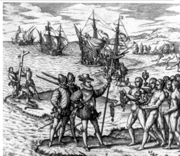
Desembarco de Colón en La Española, grabado de Theodor de Bry, 1559

Por su parte, el desarrollo humano en el continente americano se había iniciado, principalmente, a partir de la ocupación del territorio por pueblos de origen asiático, especialmente de las estepas siberianas o, para algunos, de la región del Sudeste asiático, 5 en diversas corrientes de ocupación, que se sucedieron con una antigüedad, desde al menos, de 30 mil años desde la época actual.