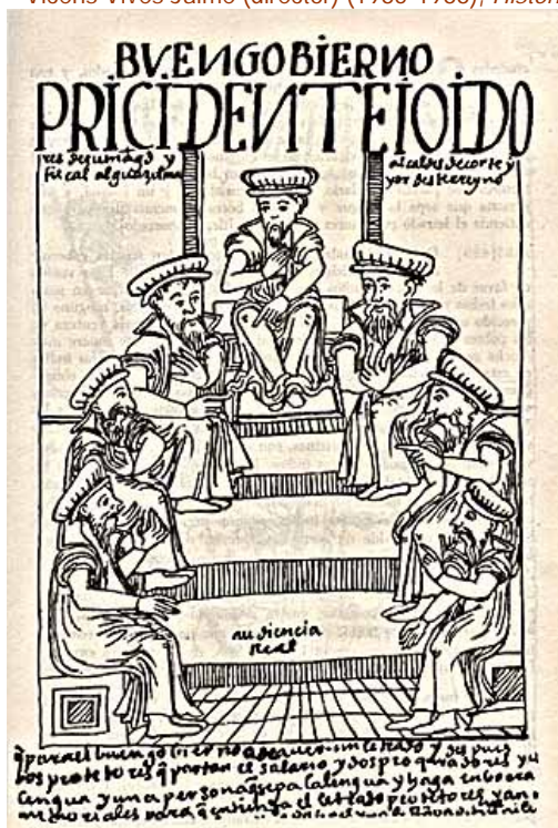
Funcionarios de la Real Audiencia. Guaman Poma de Ayala, El primer nueva crónica y buen gobierno (1615/1616)

Vicens Vives Jaime (director) (1985-1988), Historia social y económica de España y América , Barcelona, Vicens-Vives