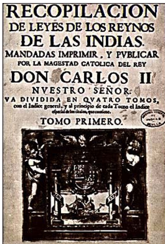
Antonio de León Pinelo y Juan de Solórzano Pereira (1680), sancionada por Carlos II de España [1665-1700]

Sobre la Audiencia únicamente se encontraba el Consejo de Indias , al que únicamente se podía recurrir en los casos de mayor categoría. Una función importante de este tribunal real consistía en la asesoría a la autoridad política del territorio asignado a su jurisdicción, por lo que se constituyó en un organismo consultivo de vital importancia para los virreyes y gobernadores.