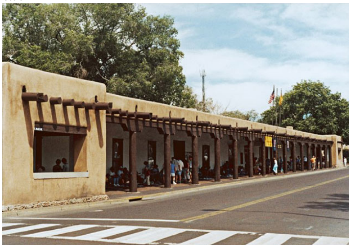
Palacio del Gobernador [ca. 1610], Santa Fe, Nuevo México, EUA http://www.smith.edu/vistas/vistas_web/gallery/detail/palace_govs_det.htm