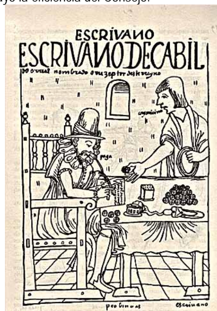
Guaman Poma, El primer nueva crónica y buen gobierno (1615/1616)

Existieron diversos tipos de gobernaciones, dependiendo de la naturaleza del territorio incorporado y del número y la actitud de la población nativa.