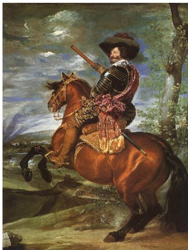
Don Gaspar de Guzmán y Pimentel (1587-1645), Conde-Duque de Olivares. Valido del rey Felipe IV. Retrato de Velázquez http://www.museovirtual.org/cuadro40.htm