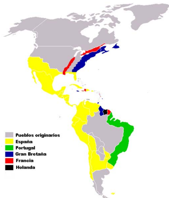
Colonias europeas y pueblos originarios, siglos XVI-XVIII http://es.wikipedia.org/wiki/Imagen:Colonias_europea_en_Am%C3%A9rica_siglo_XVI-XVIII.png

En el territorio de su unidad administrativa fue el jefe civil y militar, y tenía a su cargo la aplicación de la justicia, la administración del tesoro y los aspectos seculares del gobierno eclesiástico en cumplimiento del Real Patronato . 1 Por sus atribuciones de gobierno siempre se le designó virrey o gobernador; por las militares fueron invariablemente capitanes generales; por las hacendarias eran ordenadores del pago del erario y, más tarde, titulados superintendentes de la Real Hacienda . En el terreno judicial fueron presidentes de la Audiencia en la ciudad en que residían, y tenían jurisdicción disciplinaria sobre los oidores , pero sin intervenir en pleitos y sentencias, debido a que no siempre eran letrados en jurisprudencia.