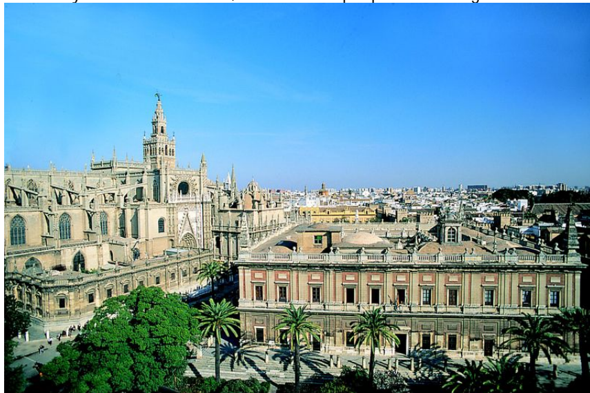
Casa de contratación y catedral de Sevilla

Sevilla contaba con una amplia población y una importante actividad mercantil internacional, que comerciaban en el Atlántico y las costas africanas, al mismo tiempo que ofrecía seguridad ante eventuales ataques de piratas mediterráneos.