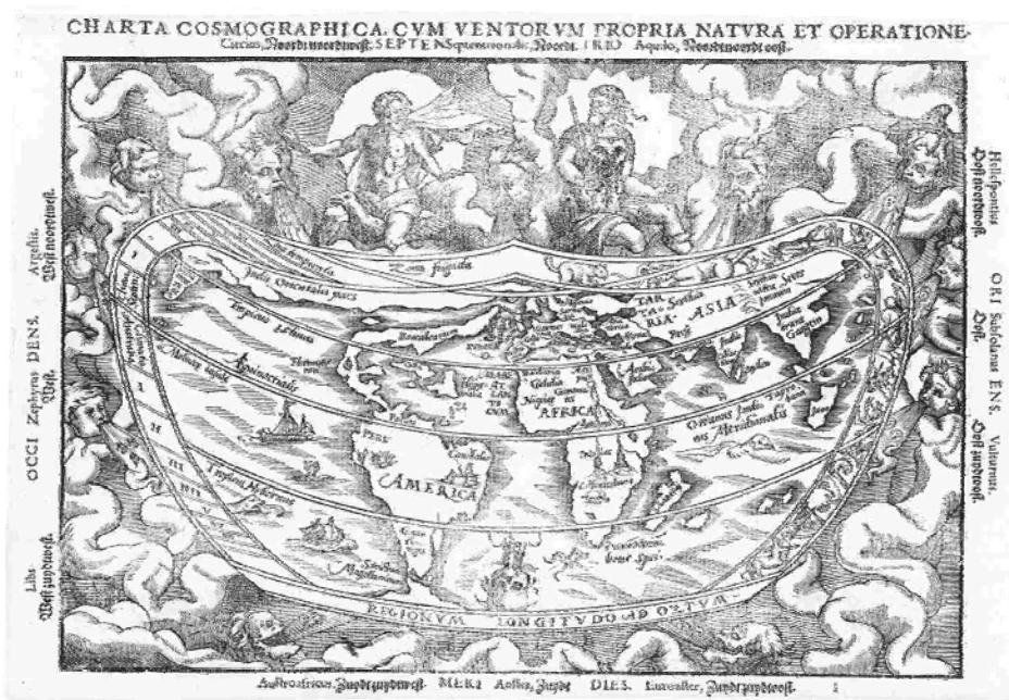
Charta Cosmographica, Apian(us), 1544, http://www.ub.es/hvirt/dossier/mapas/apianus.htm

El virrey, además, pertenecía a la nobleza española cercana al monarca y ejerció la autoridad suprema dentro de su jurisdicción indiana.