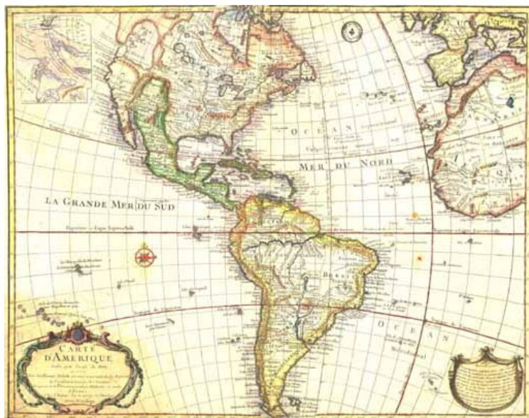
Carte d'Amérique (Mapa de América) de Guillaume Delisle, 1774 http://es.wikipedia.org/wiki/Imagen:CartedAmerique.jpeg