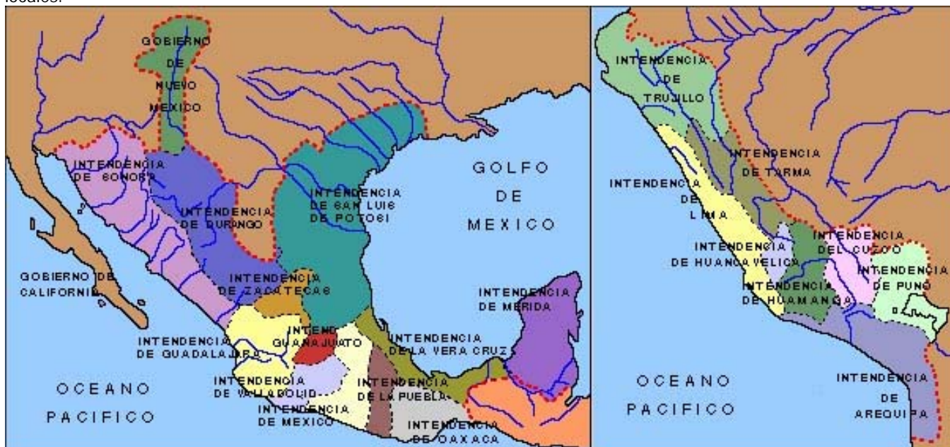
Navarro García Luis (coordinador) (1983), Historia General de España y América , Madrid, Editorial Rialp, T. VII

pretendían generar una burocracia judicial más eficaz y, sobre todo, independiente de la sociedad colonial y los intereses locales.