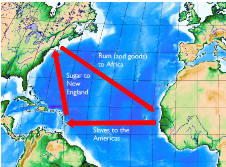
Triangulación de la trata de esclavos africanos entre América y el África: Ron y artículos manufacturados hacia África; de aquí se comerciaba con esclavos hacia las antillas y, de ahí, se traficaba azúcar hacia Nueva Inglaterra http://es.wikipedia.org/wiki/Imagen:Triangle_trade.png