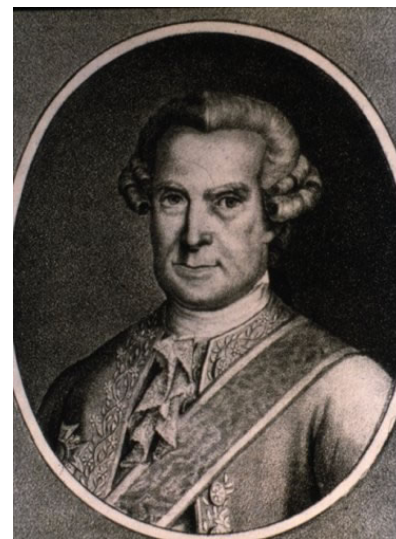
José de Gálvez, marqués de Sonora

Con la reforma del sistema judicial los monarcas deseaban erradicar la corrupción y la incompetencia de las Audiencias americanas, reforzar la autoridad de la monarquía a costa del fuero eclesiástico y, por último, mejorar la calidad y honradez de la administración de justicia, especialmente en las regiones de mayor población indígena, frenando los abusos de los funcionarios. Para ello, la corona suspendió la designación de criollos en las Audiencias y, además, agregó un regente proveniente de España, que informaría al Ministro de Indias de las resoluciones más importantes. Estas medidas