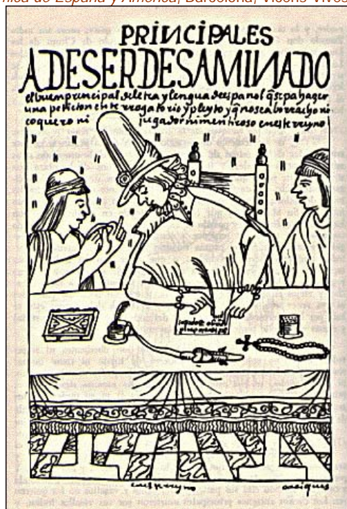
Funcionarios de la Real Audiencia. Guaman Poma de Ayala, El primer nueva crónica y buen gobierno (1615/1616)

Sus atribuciones eran amplias y comprendían todas las materias concernientes al gobierno, justicia, guerra y hacienda. Tenía funciones meramente consultivas y los acuerdos adoptados sobre cualquier asunto, tras las deliberaciones, eran presentados al rey en un documento denominado consulta ; en su margen el soberano escribía su decisión final. Una vez conocida la voluntad real, se redactaba la disposición definitiva para su promulgación y ejecución.