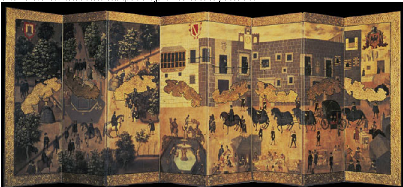
Biombo del Palacio Virreinal en la Ciudad de México, siglo XVII, Museo de América, Madrid http://www.smith.edu/vistas/vistas_web/gallery/detail/biombo_det.htm

Una función principal era la de conservar y aumentar las rentas reales y nombraba a la mayoría de los funcionarios coloniales menores, laicos y eclesiásticos, por lo que su poder era muy grande, lo mismo que sus enemigos y competidores. Entendía en primera instancia en todos los pleitos referentes a los indígenas. También reasignaba las encomiendas vacantes, práctica ésta que dio lugar a muchos celos y discordias.